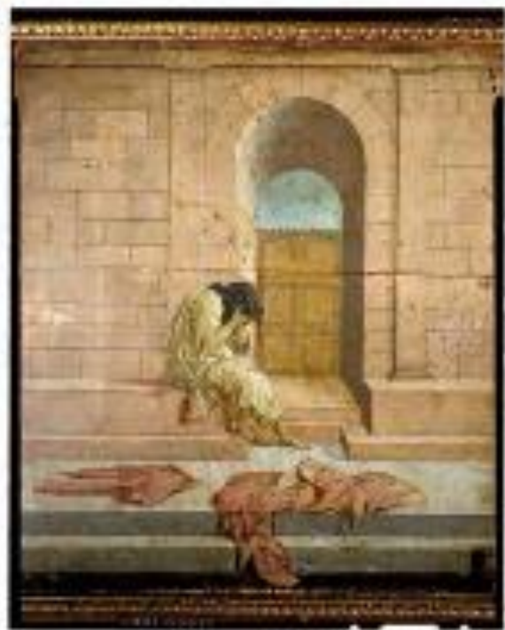
Botticelli e Filippino Lippi – Storie di Mordechai (1475-1480)