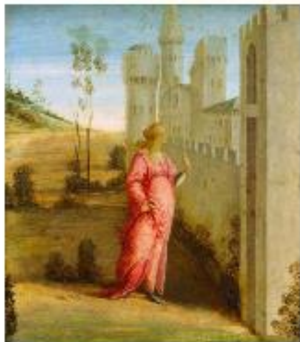
Botticelli e Filippino Lippi – La scelta di Esther (1475- 1480)