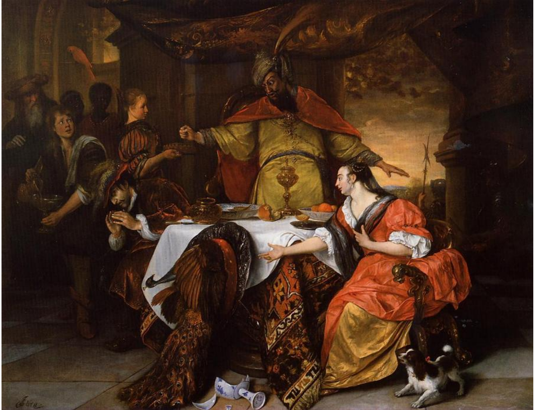
Jan Steen, L'ira di Assuero (1626-1679)